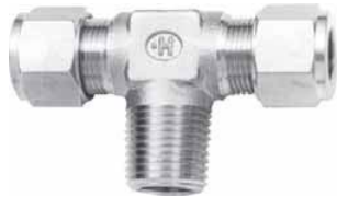
Вид метрической арматуры